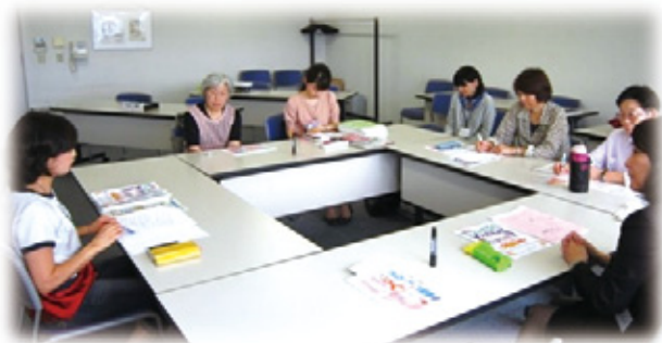
ボランティアフォローアップ講座

児童虐待対応の社会的取り組みとして、市町に要保護児童対策地域協議会が設置されています。事例の発見、援助方針等を検討し、関係機関に役割を依頼しています。特に保育所で担うのは、「見守り」援助ですが、それを担う保育士の精神的疲労感についてはあまり取り上げられていませんでした。今年度から、不適切な養育状況下にある子どもに対応する保育士への相談・助言等を行うことを目的に、保育所出張相談を行いました。福井市子ども福祉課、子育て支援室、統括園長と協議を行い、まずは、福井市の公立保育園で実施しました。