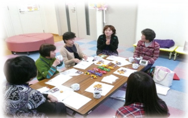
ボランティア交流会