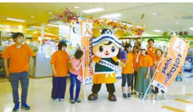
ショッピングセンターでの啓発活動／ボランティアサポーター