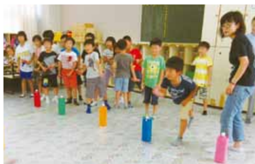
クップ(スウェーデンの遊び)を体験する子どもたち

森田地区児童館における英語教室では、「世界の遊びを体験しよう」というテーマでアメリカ、ネパール、スウェーデンの遊びを取り上げ、それぞれの遊びの中で使う英単語を学びました。特にクップというスウェーデンの遊びは単純そうに見えてなかなか難しく、チーム戦で盛り上がりました。子どもたちの異文化に対する理解を深められるような活動を今後も続けていきたいと考えています。