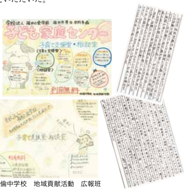
明倫中学校 地域貢献活動 広報班 ポスター作り

さらに、中学生による地域貢献活動の受け入れを初めて行った。地域施設の広報活動をする取り組みであり、当所には広報班4名の生徒が見学と調査のため来所。彼らの柔軟な発想から作り上げられた4枚のポスターの提供をいただいた。