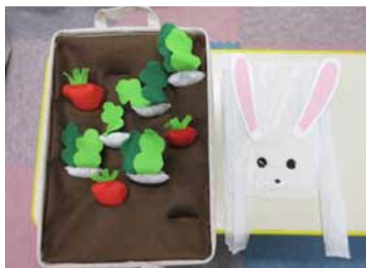
AOSSA 子育て支援室 11月の講座用に作成した教材

には、身近な人との心のこもったコミュニケーションを体験することが大変重要であると考えます。私たちが作成した教材がその一助になれば嬉しく思います。