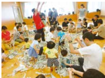
8月24日「ミュージック・ケア」