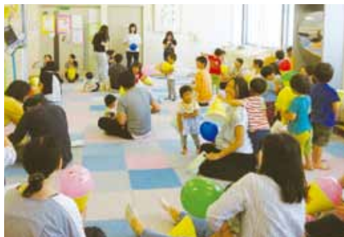
AOSSA 子育て支援室 5月の講座の様子

AOSSA子育て支援室における公開講座では、食べ物や顔のパーツなど日常生活の中で使う英単語を中心に学びました。またそれらの英単語を用いてご自宅でもおままごとやごっこ遊び等で活用してもらえるような教材作りを心掛けました。特に11月の講座で用いたフェルト手芸の野菜は、英語サークルの学生たちと試行錯誤を重ね、こつこつと手縫いした思い出の教材です。幼児が英語を学ぶ際