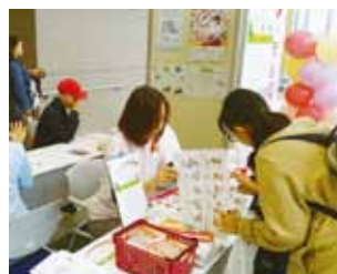
NPO法人心からだサポート協会 「親子のコミュニケーションのヒント」