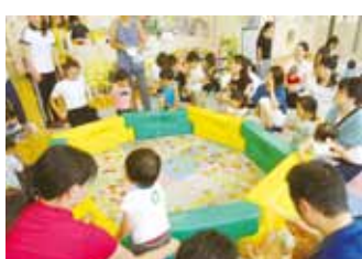
「えいごであそぼう」 仁愛女子短期大学学生