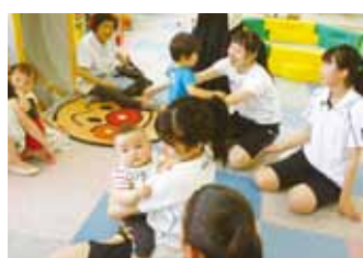
体験学習 仁愛女子高等学校生徒