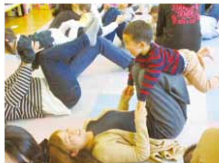
11月21日「リトミックあそび」