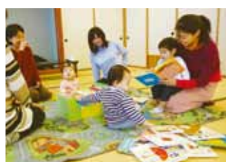
松本公民館 地域支援活動