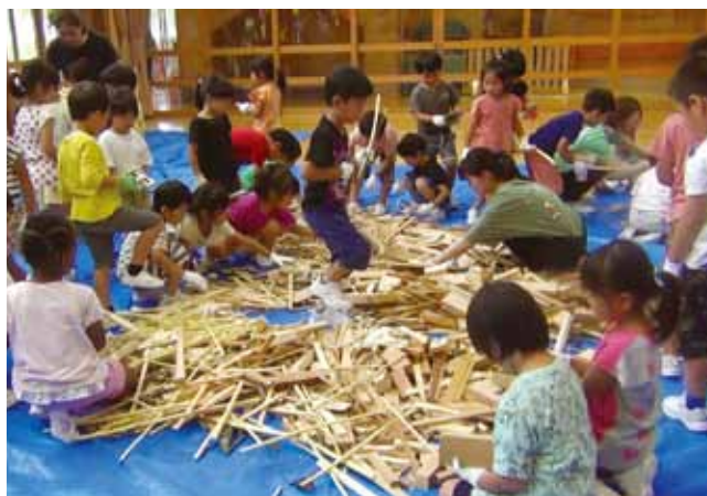
多様な材料をいつでも取りに行けるよう環境構成を行う 年長児

これまでに関わった幼児は600人を超えるまでになりましたが、この講座を通じて私が子どもから学んだ最も大きなことは、子どもの力といひましようか、その圧倒的な生命力の再認識です。「造形遊び」の提唱者は、「子どもと切実に生き合う」と述べています。この「切実に」という言葉はいかにも大げさなようですが、子どもとの関わりを通じ納得がいくものとなりました。それは、主体的に集中して活動に取り組む子どもたちの真剣な表情に端的に表れています。