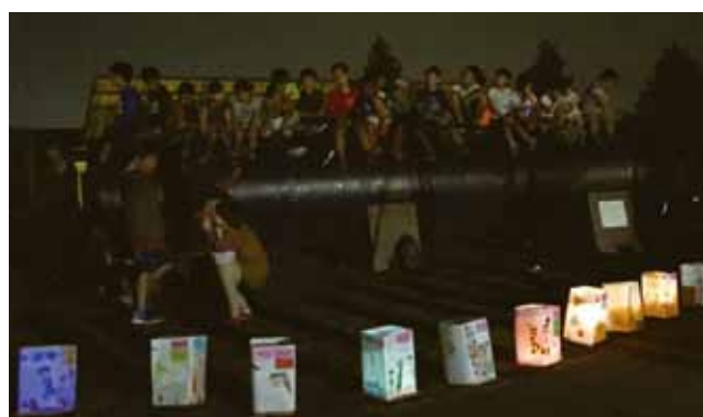
現代に蘇った龍の退治に必死で声援を送るこどもたち