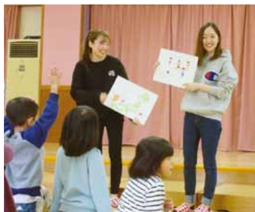
韓国の遊びについて説明している様子

今年度初めての試みとして、小学校高学年（4、5、6年生）を対象とした2日間の講座をゼミ生2人が担当させていただきました。小学生のみなさんに“気持ちを込めて英語を話す”という体験をしてもらいたいと考え、森田公民館の皆様にご協力いただき、英語劇「The Shoemaker and the Elves（こびとのくつや）」を参加児童7人で練習しました。短い時間で英語のセリフを覚えることはとても難しかったと思いますが、全員が自分のセリフをしっかりと暗記し、最後に保護者の方々の前で堂々と英語を使って役を演じる姿には大変感動しました。保護者の方からは「家でも練習し、英語に興味を持ったようだった」などのご感想をいただきとても嬉しく思いました。ご協力いただきました公民館の皆様、そしてご参加いただきました皆様、本当にありがとうございました。