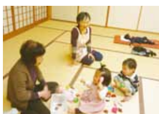
「ほっとるーむ はぐはぐ」 子育て支援ボランティア たまごの会