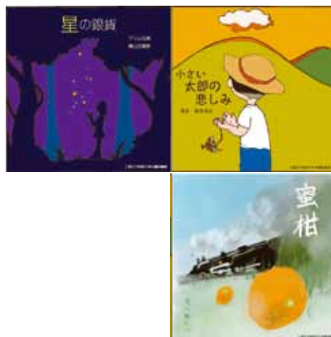
今年度優秀賞受賞作品

Webサイト「青空文庫」には著作権の切れた古い文学作品が掲載されています。その中から3作品（今年は、『蜜柑』・『小さい太郎の悲しみ』・『星の銀貨』）を図書館が選び、作品の持つ魅力を一層際立たせる様な「表紙デザインコンテスト」を行いました。優秀賞受賞者には、副賞として図書カードと作品を表紙にした文庫本を贈呈しています。