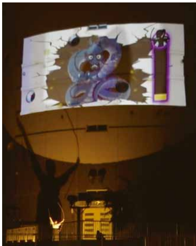
クライマックスの龍退治シーン プロジェクトマッピング

この企画に関わった学生たちは、プロから仕事の厳しさややりがいを大いに学ぶ機会となったようです。