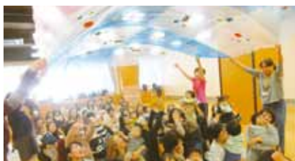
AOSSA6階レクリエーションルーム／季節の行事