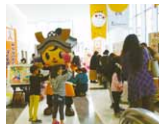
ボランティアサポーター YouTubeに投稿