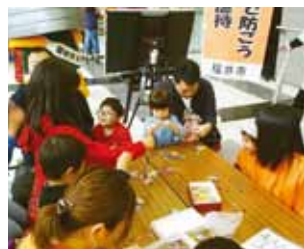
クリップUFOキャッチャー作り