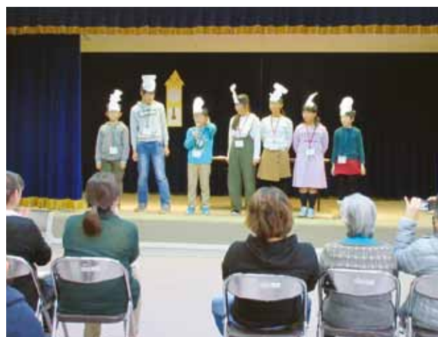
発表を終え保護者の前で挨拶をする子どもたち

今年度初めての試みとして、小学校高学年（4、5、6年生）を対象とした2日間の講座をゼミ生2人が担当させていただきました。小学生のみなさんに“気持ちを込めて英語を話す”という体験をしてもらいたいと考え、森田公民館の皆様にご協力いただき、英語劇「The Shoemaker and the Elves（こびとのくつや）」を参加児童7人で練習しました。短い時間で英語のセリフを覚えることはとても難しかったと思いますが、全員が自分のセリフをしっかりと暗記し、最後に保護者の方々の前で堂々と英語を使って役を演じる姿には大変感動しました。保護者の方からは「家でも練習し、英語に興味を持ったようだった」などのご感想をいただきとても嬉しく思いました。ご協力いただきました公民館の皆様、そしてご参加いただきました皆様、本当にありがとうございました。