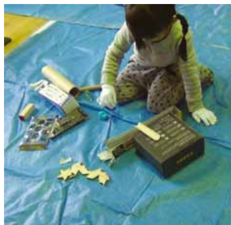
ビー玉転がしの装置を多様な材料で試みる 年中児