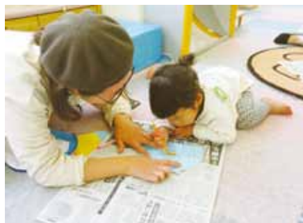
4月17日「1枚の紙からたのしいおはなし」