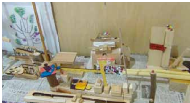
多様な作品の完成 年長児