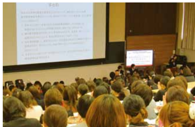
シンポジウムにおける福井市研究指定園の話題提供の様子