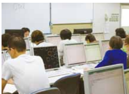
図1：9月1日(日) Excel講座の様子

Excel講座は2019年9月1日(日)の9:00～16:00に行い、参加者は26名でした(一般の方のみ)。この講座では、