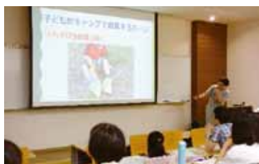
キャンプについて説明を聞いている様子

また、講座スタッフとして福井県キャンプ協会から講師2名と、本学の学生ボランティア2名にも協力をしていただき、個別相談や子どもたちへの対応が出来るように配慮をしました。受講者の参加理由に、「キャンプに興味はあるけど、何から始めてよいか分からない」や「子どもと一緒に楽しみたいから」などが多くあったので、親子の不安が少しでもなくなる様、初級編として、わかり易く、ゲームなどをしながら楽しく講座を進めました。