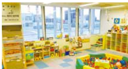
AOSSA5階子育て支援室／乳幼児親子のあそび場

子育て支援室・相談室は、福井市委託事業として平成19年度に業務を開始してから、今年度で13年を迎えた。地域子育て支援拠点機能と家庭相談機能の充実を図りながら事業の運営に努めた。