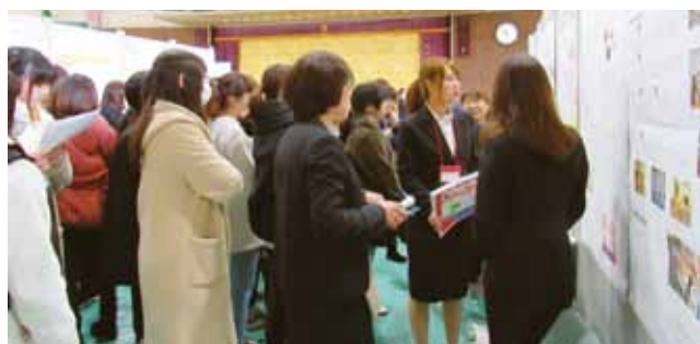
現職者、学生の前でポスター発表を行う2回生