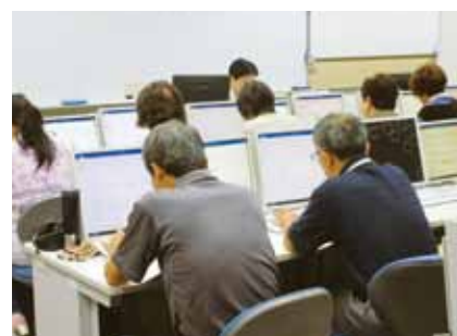
図2：9月8日(日) Word講座の様子

(Excelとの連携を含む)、画像、SmartArtなどについて取り扱いました。また、やや応用的な内容として、文章の開始、終了位置などを変更するためのルーラーや、文章を印刷する際に、宛先や日付などの一部の項目をExcel等の表から挿入する差し込み印刷についても簡単に触れました。図形についても取り扱っておきたかったのですが、時間の関係上割愛しました。