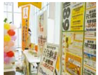
子育て支援等の情報提供