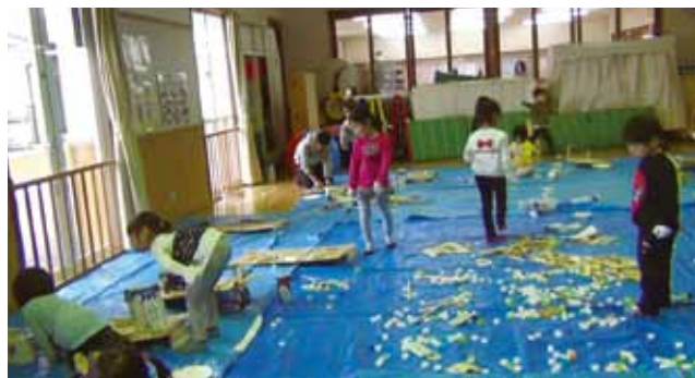
ホール全体を使う 中央に置いた材料がほとんどなくなっている 年中児