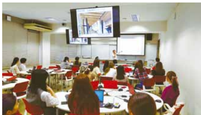
市職員の説明の様子

この様子は、翌日の新聞や夕方のテレビニュース番組でも大きく報道され、福井市役所の公式ページでも紹介されています。また、本学澤崎研究室のYouTubeチャンネル「さわらぼ」でも全ての作品を公開していますので、ぜひご覧ください。