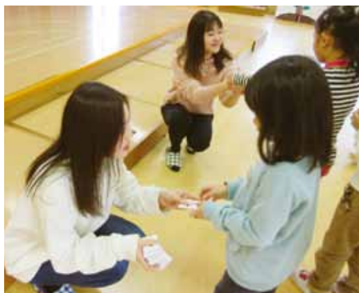
学生が作成した英語カルタを手渡している様子

永平寺町の幼稚園・幼児園では「幼児向け英語教材」と「異文化理解教育」を卒業研究のテーマとした学生4人が講座を担当させていただきました。英語教材については保護者の方々のご意見も参考にした上でオリジナルの教材（英語カルタ）を作成しました。また、異文化理解教育では韓国の「投壺（とうこ）」という遊びを取り上げ、チーム対抗戦で楽しんでもらいました。幼児を前にして講座を行うことは学生にとって初めての体験で少々戸惑う場面も見られましたが、安全面に配慮した環境設定や、幼児が家族や友達とのコミュニケーションを通して英語を学ぶことの重要性について深く学ぶことができたと思います。幼稚園・幼児園の先生方、またアンケートにご協力いただきました保護者の方々に深く御礼申し上げます。ありがとうございました。