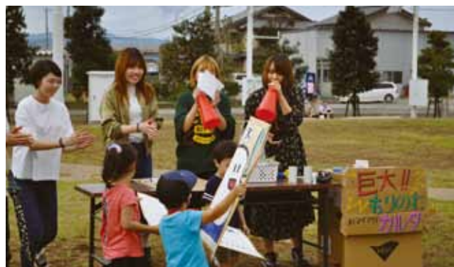
大はしゃぎのこどもたち「巨大もりのわカルタ」