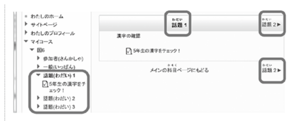
図3 rubyタグを指定して表示される例

例：<ruby>話題<rp> ( </rp><rt>わだい</rt> <rp> ) </rp></ruby>