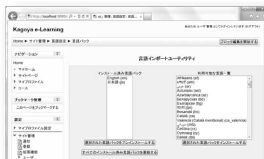
図1 利用する言語パックの指定

ち手軽に利用できる LMS がないことも原因と考えられる。しかし今後は学習環境の変化に対応し、電子教材の配布や児童間の情報共有プラットフォームとなるものが必要とされると考えている。