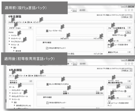
図5 マウスオーバーにより読みが表示される例

図5は、外来語を含めて置換した例で、「Home」を「ホーム」、「マイホーム」を「わたしのホーム」、「マイプロフィール」を「わたしのプロフィール」、「フォーラム」を「掲示板」といったように、ある程度小学生でも理解できるように表示している。